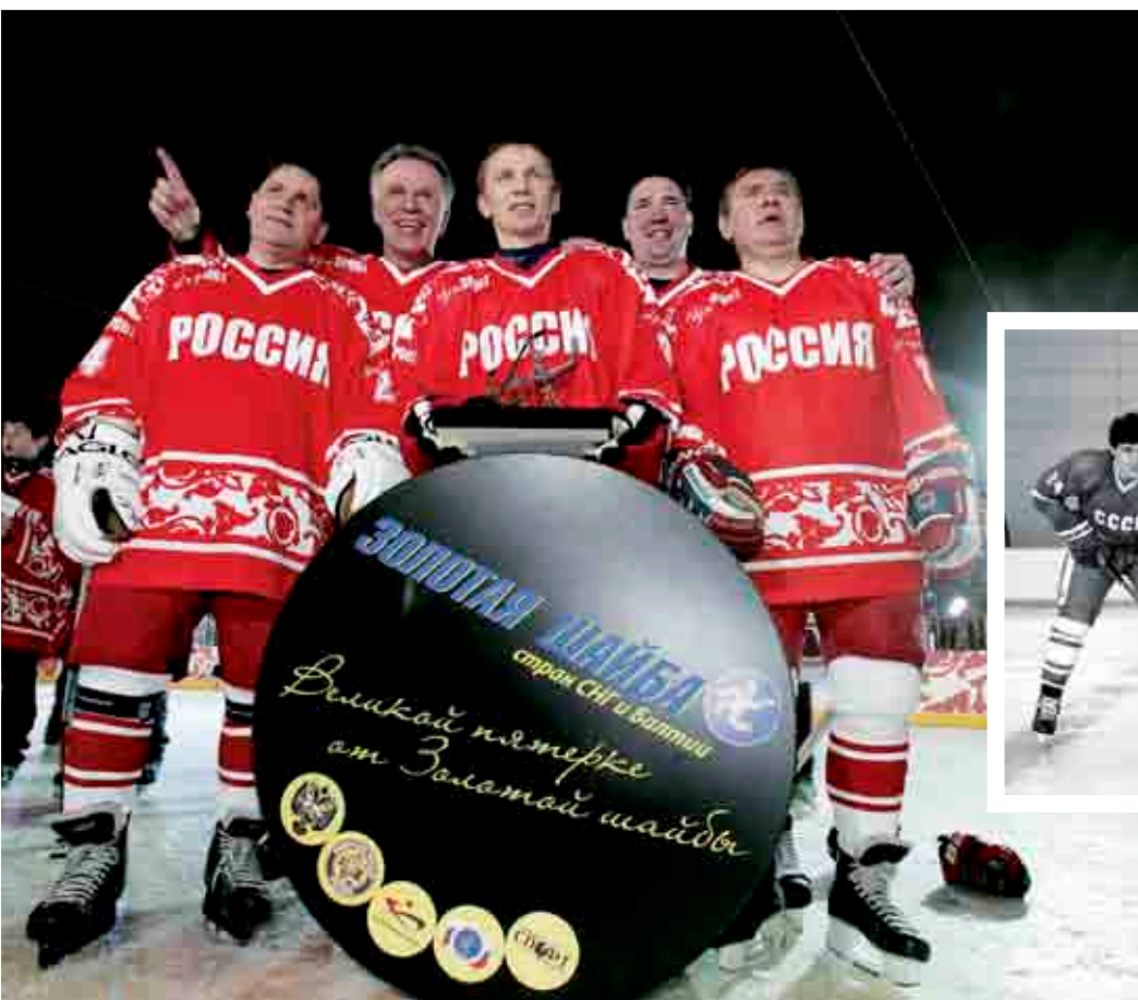
◀ NEJSLAVNĚJŠÍ HOKEJOVÁ FORMACE V ČASECH NEJVĚTŠÍ SLÁVY A PŘI SLAVNOSTI NA RUDÉM NÁMĚSTÍ V ROCE 2006. VPŘEDU ÚTOČNÍCI SERGEJ MAKAROV, IGOR LARIONOV A VLADIMIR KRUTOV. VZADU OBRÁNCI VJAČESLAV FETISOV A ALEXEJ KASATONOV.

„Je to především štěstí a privilegium, když máte okolo sebe dobré hráče, můžete se rozvíjet mnohem rychleji a vyjadřovat svou hrou. Můžete ukázat to nejlepší, co ve vás je, když máte okolo sebe lidi, kteří rozumějí vaší mentalitě, vašemu stylu a vaší představě o hře. Měl jsem štěstí, že jsem s takovými hráči hrál skoro celou kariéru, ať už to bylo v Chimiku Voskresensk, CSKA, Detroitu nebo San Jose. Když máte okolo sebe tak skvělé hráče, je strašně snadné mít úspěch a věřit, že se vám společně všechno povede. Není to jako v tenise, kde hraje každý jen sám za sebe. Je to týmová hra,