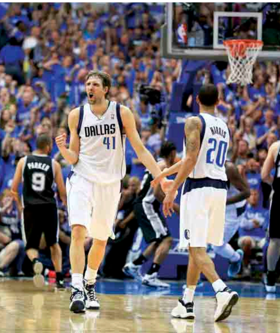
^ DIRK NOWITZKI, LÍDR DALLAS MAVERICKS, VÍTEŽ NBA (2011) A JEJÍ NEJUŽITEČNĚJŠÍ HRÁČ (2007)

Možná nejsilnější pokyny, které můžeme vštípit do budoucích lídrů, je pochopit, že čas a láska jsou dva největší dary. Když máte čas, je snazší milovat. Když milujete, čas stojí. Vše ostatní přijde, lidé vám budou věřit, zapalujete své nejbližší okolí a ono vám to opětuje, otevře se prostor k vidění věci z jiné perspektivy, vnímáte situace v souvislostech, máte trpělivost řešit problémy větší, než jste vy sami, přicházejí za vámi lidé, kteří mají podobnou vášeň. Ze všech těchto atributů a z mnoha dalších vznikají příběhy, které by se nestaly. Každý den je pak příležitost využít tyto dary. Chovejte se k nim jako k pokladu a používejte je moudře. Uděláte hodně chyb, ale nevzdávejte to. Učte se to a posouvejte se o krok dál. Jen tak boj za leadership může zvítězit.